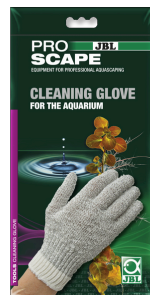
JBL PROSCAPE CLEANING GLOVE Guante para la limpieza del acuario