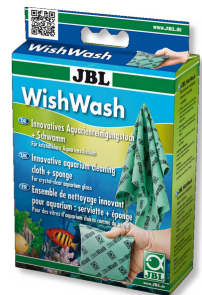
JBL WishWash Trapo y esponja