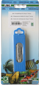
JBL Aqua-T Handy 5 cuchillas de recambio Cuchillas de recambio para Aqua-T Handy