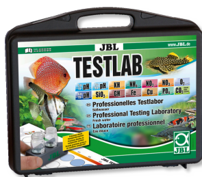
JBL Testlab Maletín con 13 tests para analizar agua dulce Testlab