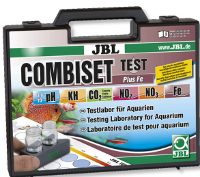
JBL Test Combi Set Plus Fe Maletín con los test más importantes + test de hierro