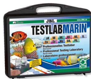
JBL Testlab Marin Maletín tests profesional para analizar el agua salada