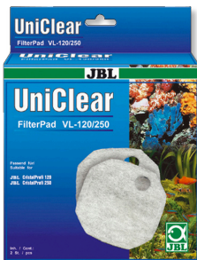
JBL FilterPad VL

Filtro de algodón para filtros CristalProfi