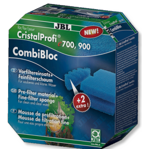
JBL CombiBloc CristalProfi e Material prefiltrante y espuma para CristalProfi e