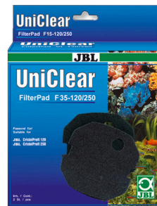
JBL FilterPad F35 Espuma de poro fino para el filtro CristalProfi