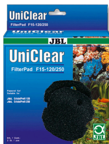
JBL FilterPad F15

Fieltro de algodón para filtros CristalProfi