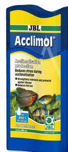
JBL Acclimol Acondicionador para la aclimatación de peces nuevos