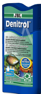
JBL Denitrol Activador biológico para introducir peces de acuario