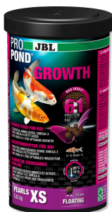
JBL PROPOND GROWTH XS

Aliment spécial croissance pour très petits koïs