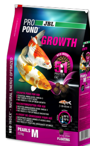
JBL PROPOND GROWTH M

Aliment spécial croissance pour koïs de petite taille