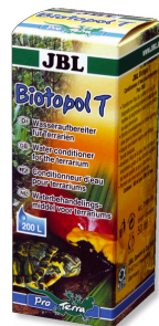
JBL Biotopol T

Aliment complet pour insectes alimentaires