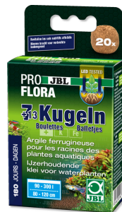
JBL PROFLORA 7 + 13 boulettes

Fertilisant racinaire, aquarium d'eau douce