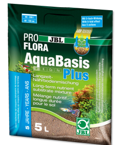
JBL PROFLORA AquaBasis plus

Engrais longue durée pour aquariums d'eau douce