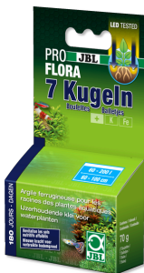
JBL PROFLORA 7 Boulettes

Fertilisant racinaire, aquarium d'eau douce