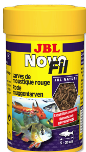
JBL NovoFil Larves de moustiques rouges pour poissons d'aquarium