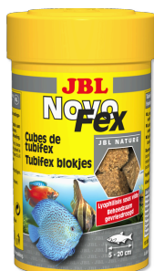
JBL NovoFex Cubes de tubifex, friandises pour poissons d'aquarium