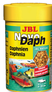
JBL NovoDaph Puces d'eau, friandises pour poissons d'aquarium