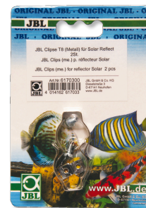
JBL Clips T5/T8 (Métal) Fixation en métal pour tubes fluorescents