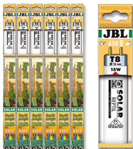
JBL SOLAR REPTIL JUNGLE T8

Tube T8 de terrarium pour animaux de forêts tropicales