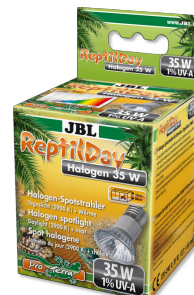
JBL ReptilDay Halogène

Tube T8 de terrarium pour animaux des déserts