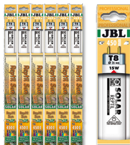
JBL SOLAR REPTIL SUN T8

Tube T8 de terrarium pour animaux de forêts tropicales