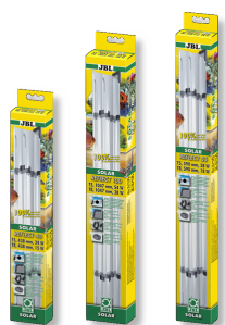
JBL SOLAR Reflect T5/ T8 (895-1500 mm) Réflecteur pour tube fluorescent SOLAR