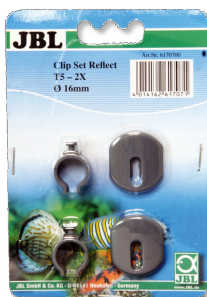
JBL SOLAR REFLECT Kit clips Fixation pour tubes fluorescents