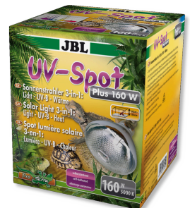
JBL UV-Spot plus

Spot halogène à spectre complet de lumière naturelle