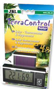
JBL TerraControl Solar Thermomètre/hygromètre solaire pour tous terrariums