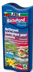
JBL BactoPond Bactéries pour l'auto-épuration des bassins