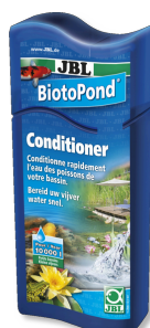
JBL BiotoPond Conditionneur d'eau pour bassin