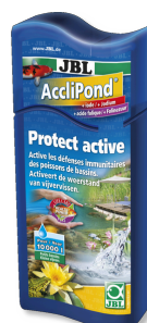
JBL AccliPond Conditionneur d'eau pour bassin