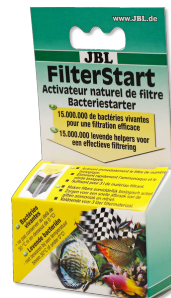
JBL FilterStart Bactéries pour activation des filtres