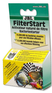
JBL FilterStart Bactéries pour activation des filtres