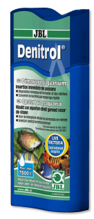
JBL Denitrol Activateur de bactéries pour poissons d'aquariums