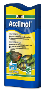
JBL Acclimol Conditionneur d'eau pour l'acclimatation des poissons