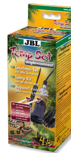
JBL TempSet angle+ connect Kit d'installation pour spot de terrarium