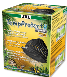
JBL TempProtect II light Protection antibrûlure pour reptiles pour JBL TempSet