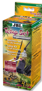
JBL TempSet angle+ connect Kit d'installation pour spot de terrarium