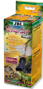
JBL TempSet angle Kit d'installation pour spot de terrarium