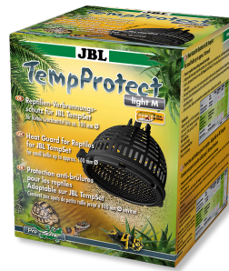
JBL TempProtect light Protection antibrûlure pour reptiles pour JBL TempSet