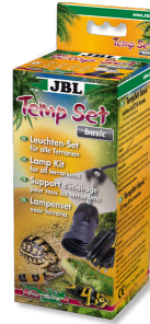
JBL TempSet basic Kit d'installation pour spot de terrarium