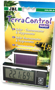
JBL TerraControl Solar Thermomètre/hygromètre solaire pour tous terrariums