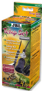
JBL TempSet connect Kit d'installation avec connecteur