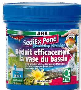
JBL SediEX Pond Bactéries et oxygène actif pour dégrader les boues