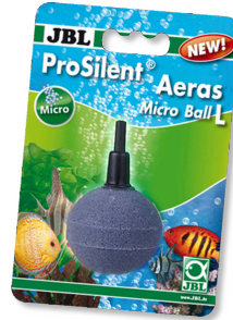
JBL ProSilent Aeras Micro Ball L

Flotteur avec protection anti- côude pour kit PondOxi