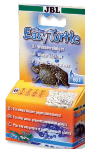
JBL Easy Turtle

Vitamines pour tortues d'eau et de marais