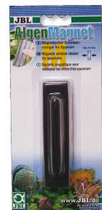
JBL Nettoyeur de vitre aimanté Nettoyeur de vitres aimanté pour vitres d'aquarium