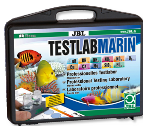
JBL Testlab Marin Coffret professionnel d'analyse de l'eau de mer