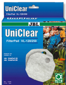
JBL FilterPad VL Ouate filtrante pour filtre d'aquarium CristalProfi