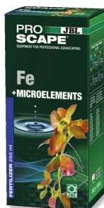
JBL PROSCAPE Fe + MICROELEMENTS Engrais végétal de base pour aquascaping