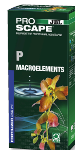
JBL PROSCAPE P MACROELEMENTS Engrais végétal au phosphore pour aquascaping