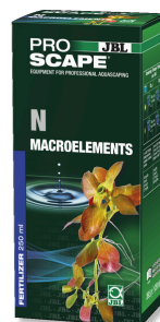
JBL PROSCAPE N MACROELEMENTS Engrais végétal à l'azote pour aquascaping