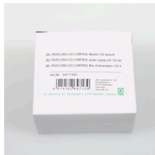
JBL PF CO2 CONTROL Bloc d'alimentation 12 V