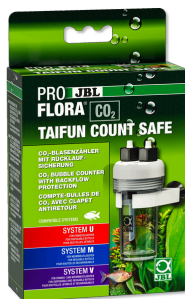
JBL PROFLORA CO2 TAIFUN COUNT SAFE Compte-bulles de CO2 avec clapet antiretour intégré