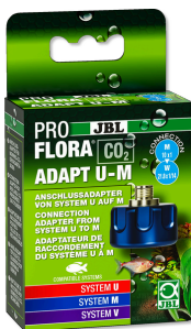
JBL PROFLORA CO2 ADAPT U - M Adaptateur bouteille jetable / bouteille rechargeable