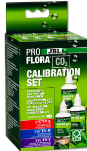
JBL PROFLORA CO2 CALIBRATION SET Pour étalonnage et conservation d'électrodes de pH