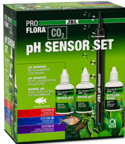
JBL PROFLORA CO2 pH SENSOR SET Électrode qualité labo pour appareils de pH