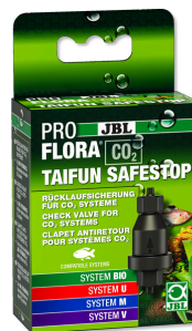
JBL PROFLORA CO2 TAIFUN SAFESTOP Clapet antiretour d'eau pour systèmes CO2