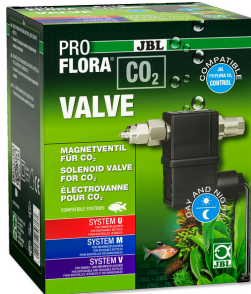
JBL PROFLORA CO2 VALVE Électrovanne de CO2 pour apport de CO2 contrôlé