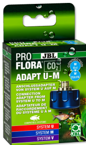
JBL PROFLORA CO2 ADAPT U - M Adaptateur bouteille jetable / bouteille rechargeable