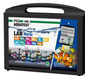
JBL PROAQUATEST LAB Marin Coffret professionnel d'analyse de l'eau de mer