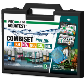
JBL PROAQUATEST COMBISET Plus NH 4 Coffret avec les principaux tests d'eau + test NH 4