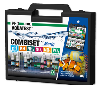
JBL PROAQUATEST COMBISET Marin Coffret de tests pour analyses d'eau en aquarium marin