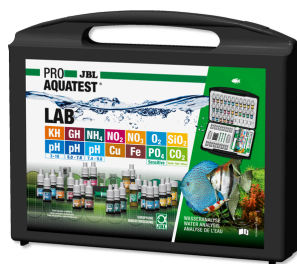
JBL PROAQUATEST LAB Coffret de 13 tests pour analyse de l'eau douce