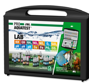
JBL PROAQUATEST LAB Coffret de 13 tests pour analyse de l'eau douce