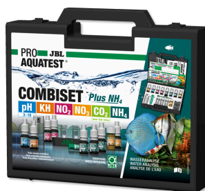
JBL PROAQUATEST COMBISET Plus NH 4 Coffret avec les principaux tests d'eau + test NH 4