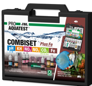
JBL PROAQUATEST COMBISET Plus Fe Coffret avec les principaux tests d'eau + test fer