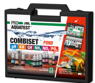
JBL PROAQUATEST COMBISET POND Coffret d'analyses d'eau en bassins