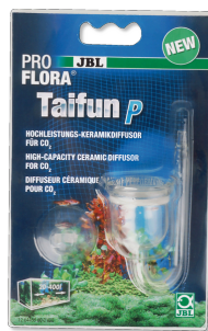
JBL PROFLORA Taifun P Mini-diffuseur de CO2 pour nano-aquarium d'eau douce