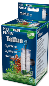
JBL PROFLORA Taifun S Diffuseur de CO2 extensible pour petit aquarium