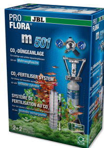
JBL PROFLORA m501 Système complet de fertilisation au CO2 des plantes aquatiques