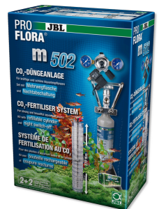
JBL PROFLORA m502 Fertilisation au CO2 des plantes aquatiques avec coupure nocturne