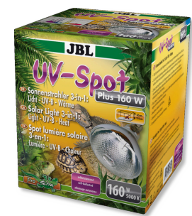
JBL UV-Spot plus Spot UV à spectre de lumière du jour pour terrarium