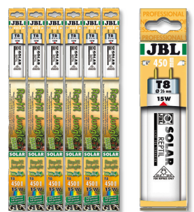
JBL SOLAR REPTIL JUNGLE T8 Tube T8 de terrarium pour animaux de forêts tropicales