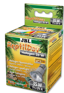
JBL ReptilDay Halogène Spot halogène à spectre complet de lumière naturelle