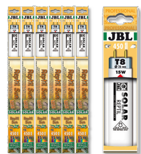
JBL SOLAR REPTIL SUN T8 Tube T8 de terrarium pour animaux des déserts