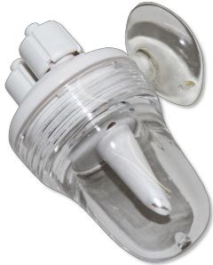
JBL ProFlora u201, compteur de bulles