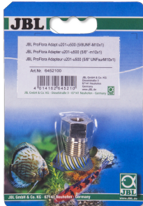
JBL PROFLORA Adapt u201-u500 Adaptateur pour détendeur u201