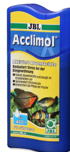
JBL Acclimol Conditionneur d'eau pour l'acclimatation des poissons