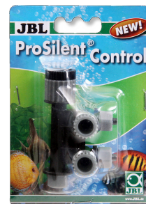
JBL ProSilent Control Robinet à air de précision réglable