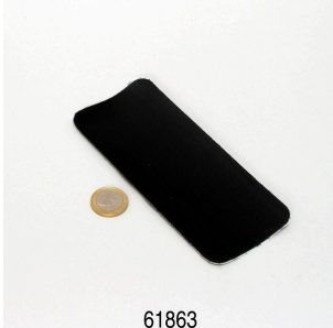
JBL Floaty Pad