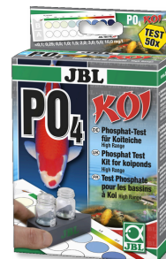
JBL PO 4 Kit test phosphate Koi Test rapide pour déterminer la teneur en phosphates