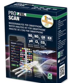
JBL PROSCAN Test de l'eau avec analyse sur smartphone