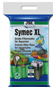
JBL Symec XL Ouate filtrante grossière contre la turbidité de l'eau