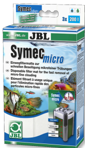
JBL Symec micro Microfibre pour filtre d'aquarium contre l'eau turbide