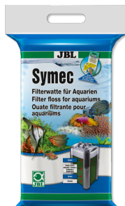
JBL Symec Ouate filtrante Ouate filtrante contre toute turbidité de l'eau