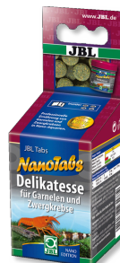
JBL NanoTabs Aliment de base pour crevettes et écrevisses naines