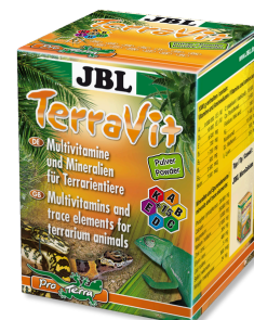
JBL TerraVit Vitamines et oligoéléments pour animaux de terrarium