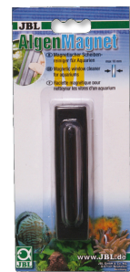
JBL Nettoyeur de vitre aimanté Nettoyeur de vitres aimanté pour vitres d'aquarium