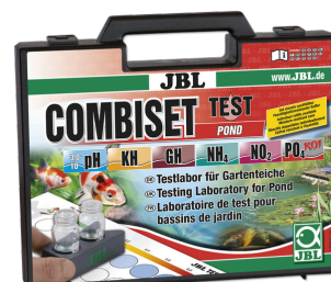
JBL Kit CombiSet Test Bassin Les tests d'eau les plus importants pour les bassins