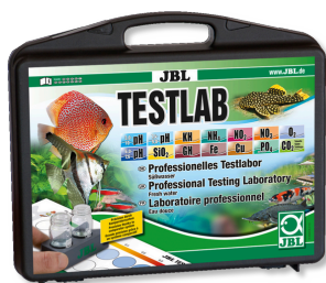
JBL Testlab Coffret de 13 tests pour analyse de l'eau douce