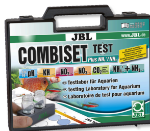
JBL Kit CombiSet Test Plus NH4 Coffret avec principaux tests d'eau + test NH4