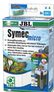
JBL Symec micro Microfibre pour filtre d'aquarium contre l'eau turbide