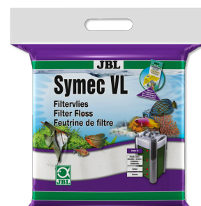
JBL Symec VL Microfibre filtrante contre toutes turbidités de l'eau