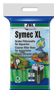
JBL Symec XL Ouate filtrante grossière contre la turbidité de l'eau