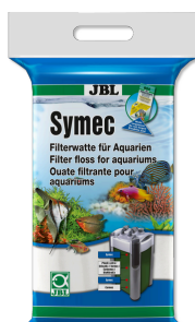
JBL Symec Ouate filtrante Ouate filtrante contre toute turbidité de l'eau