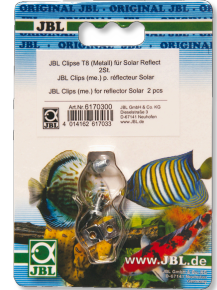
JBL Clips T5/T8 (Métal) Fixation en métal pour tubes fluorescents