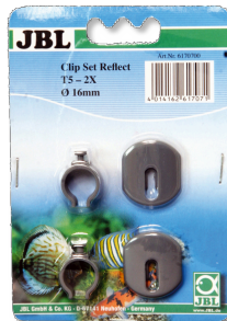
JBL SOLAR REFLECT Kit clips Fixation pour tubes fluorescents