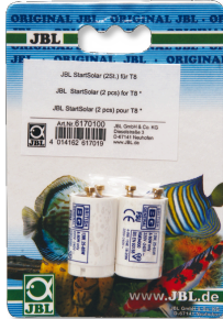
JBL Start Solar Starters pour tubes fluorescents T8