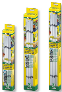
JBL SOLAR Reflect T5/ T8 (895-1500 mm) Réflecteur pour tube fluorescent SOLAR