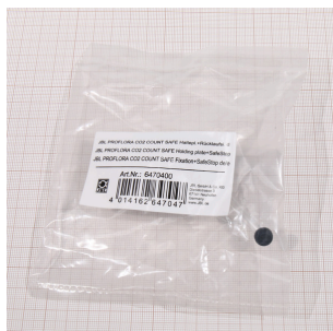
JBL PF CO2 COUNT SAFE держатель+ обратный клапан