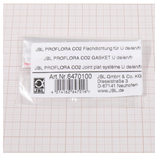
JBL PF CO2 плоское уплотнение для U