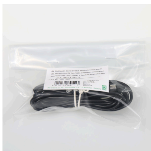
JBL PF CO2 CONTROL датчик температуры