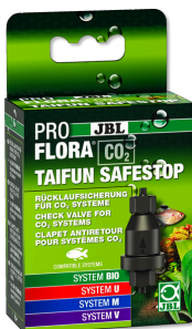
JBL PROFLORA CO2 TAIFUN SAFESTOP Защита от обратного тока воды для установок CO2