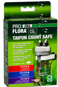
JBL PROFLORA CO2 TAIFUN COUNT SAFE Счетчик пузырьков CO2 со встроенным обратным клапаном