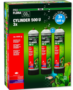
JBL PROFLORA CO2 CYLINDER 500 U 3x Запасной одноразовый баллон 500 г CO2 (упаковка 3 шт.)