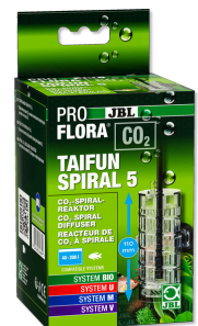
JBL PROFLORA CO2 TAIFUN SPIRAL 5 Нарастиваемый реактор CO2 для пресн. аквариумов 200 л