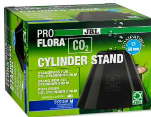
JBL PROFLORA CO2 CYLINDER STAND Подставка для баллонов CO2 500 г