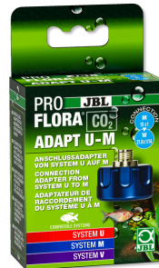
JBL PROFLORA CO2 ADAPT U - M Адаптер CO2 д/переоснащ. с одно- на многораз. баллоны