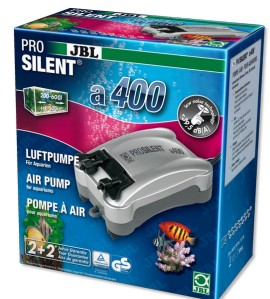
JBL PROSILENT a400 Компрессор для пресноводных и морских аквариумов