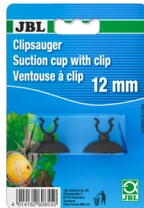
JBL suction cup with clip, 12 мм Резиновая присоска с зажимом для предметов диаметром 12 мм