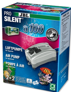
JBL PROSILENT a100 Компрессор для пресноводных и морских аквариумов