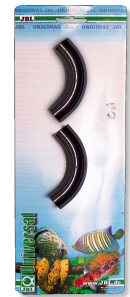
JBL AntiKink Защита от перегиба шланга