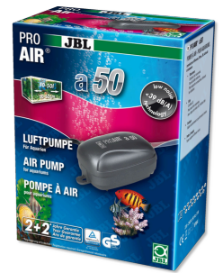
JBL PROAIR a50 Компрессор для аквариума