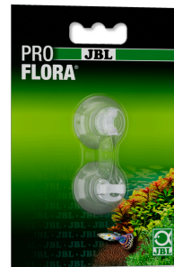
JBL suction cup with clip, 6 мм Прозрачные присоски с клипсой для объектов с диаметром \approx 6 мм