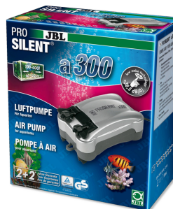
JBL PROSILENT a300 Компрессор для пресноводных и морских аквариумов