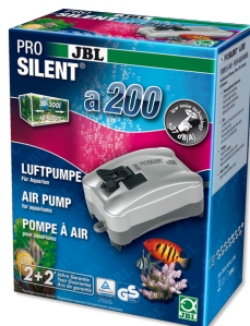
JBL PROSILENT a200 Компрессор для пресноводных и морских аквариумов