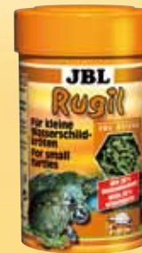
JBL Rugil Aliment en sticks pour petites tortues des marais et aquatiques