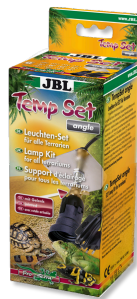
JBL TempSet angle Комплект для установки ламп в террариуме