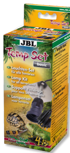
JBL TempSet basic Комплект для установки ламп в террариуме