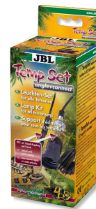
JBL TempSet angle+ connect Комплект для установки ламп в террариуме