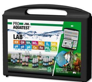
JBL PROAQUATEST LAB Чемоданчик с 13 тестами параметров пресной воды