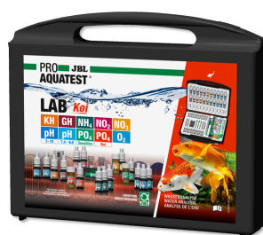
JBL PROAQUATEST LAB Koi Чемоданчик с профессиональными тестами для пруда с кои