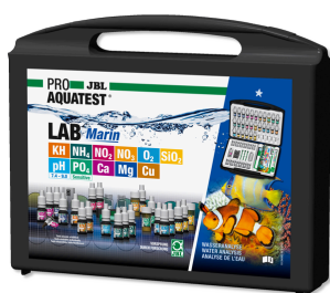
JBL PROAQUATEST LAB Marin Чемоданчик с профессиональными тестами морской воды