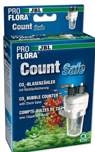
JBL PROFLORA CO2 Count Safe Счётчик пузырьков с обратным клапаном